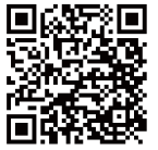
FortiGate Rugged 工規 新世代防火牆 NGFW