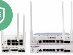
FortiGate Rugged 工規 新世代防火牆 NGFW FGR-60F/ FGR-70F/ FG-80F