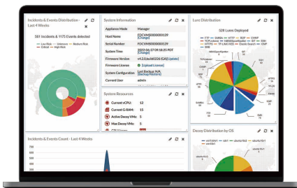
FortiDeceptor 進階欺敵偵防系統